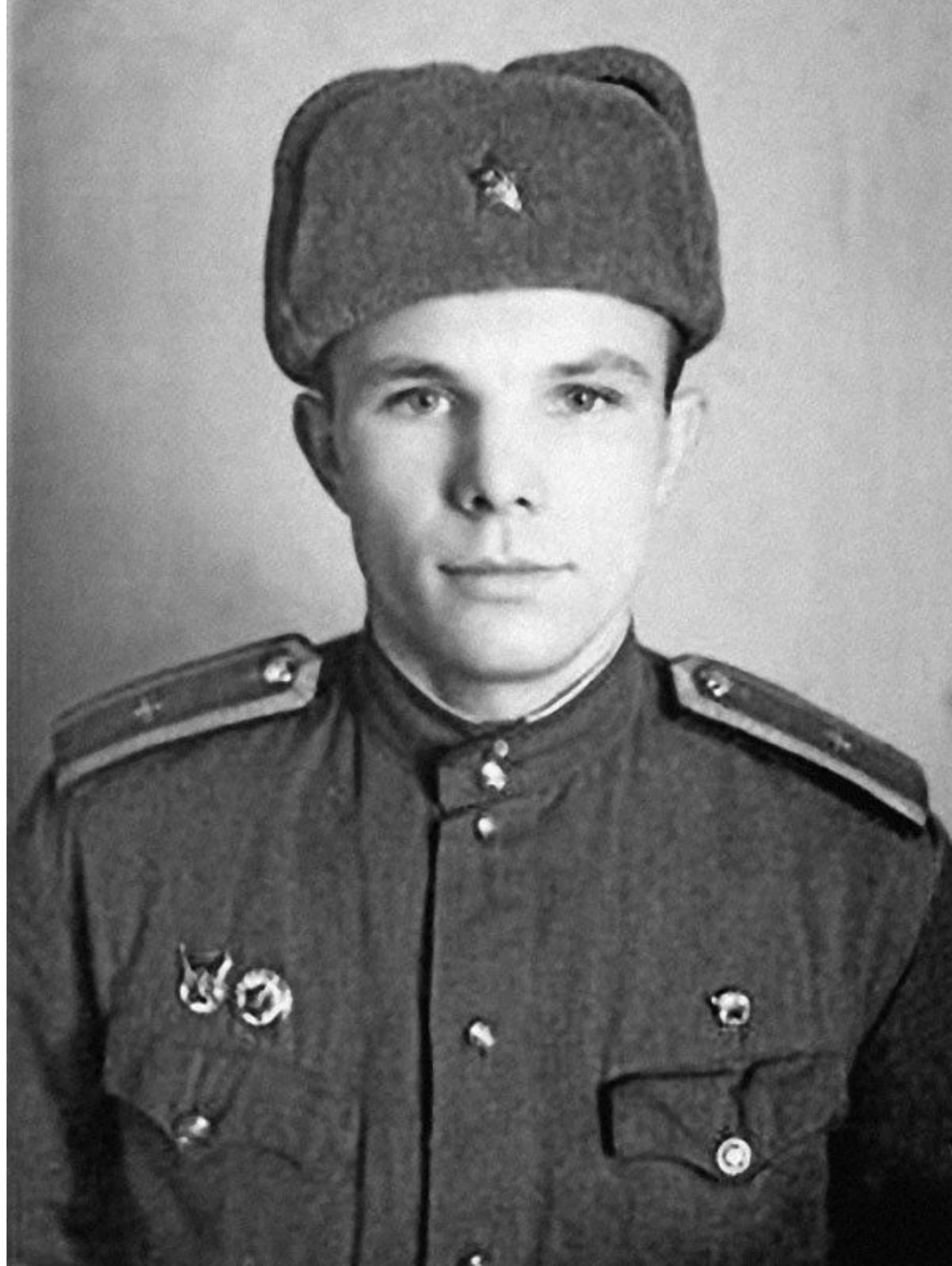
← Юрий Гагарин в 1956 г. — Курсант Чкаловского учи- лища