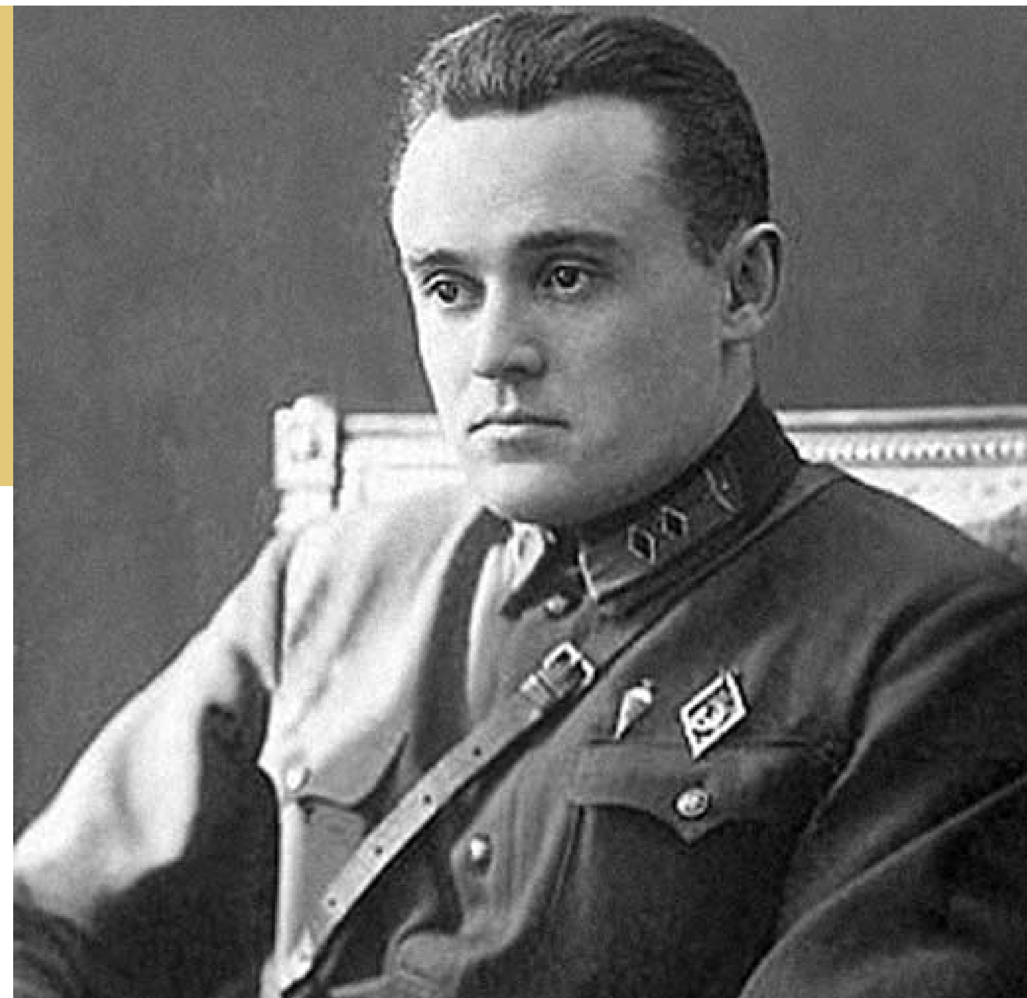
Сергей Павлович Королёв в молодости

СЕРГЕЙ ПАВЛОВИЧ КОРОЛЁВ: Космонавтика имеет безграничное будущее, и её перспективы беспредельны, как сама Вселенная.