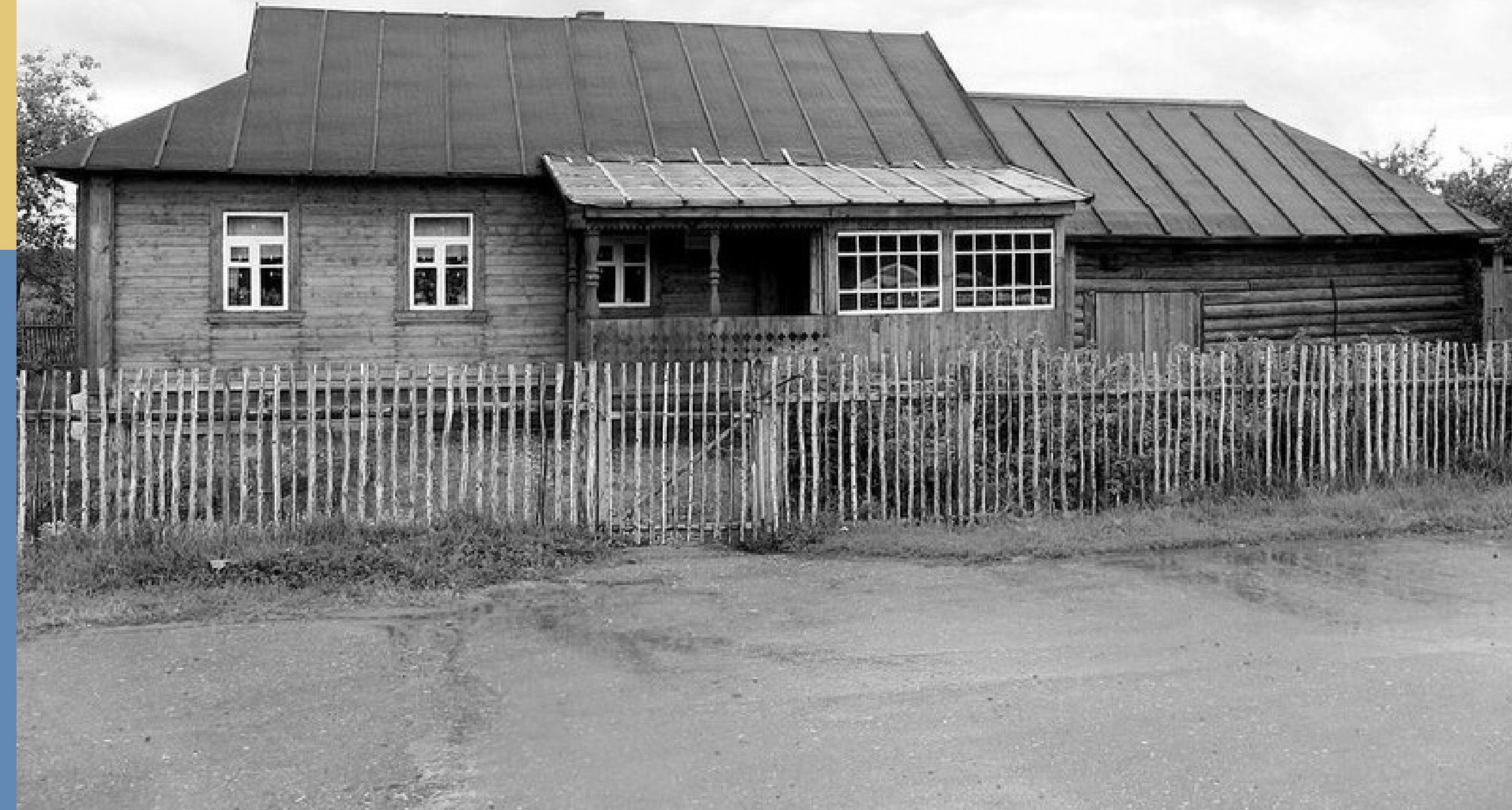
↑ Дом семьи Гагариных в селе Клушино

ЛЁТЧИК-КОСМОНАВТ СССР, ГЕРОЙ СОВЕТСКОГО СОЮЗА, ПЕРВЫЙ КОСМОНАВТ ЗЕМЛИ