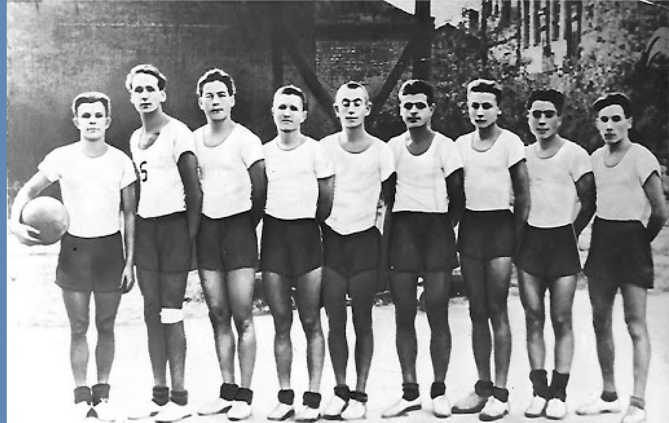
↑ Ю.А. Гагарин (первый слева) — капитан баскетбольной команды Саратовского индустриального техникума.

ГАГАРИН, «ДОРОГА В КОСМОС»: Игра в баскетбол нравилась своей стремительностью, живостью и тем, что в ней всегда царил дух коллективного соревнования. Броски мяча в корзину с ходу и с прыжка вырабатывали меткость глаза, точность и согласованность движений всего тела.